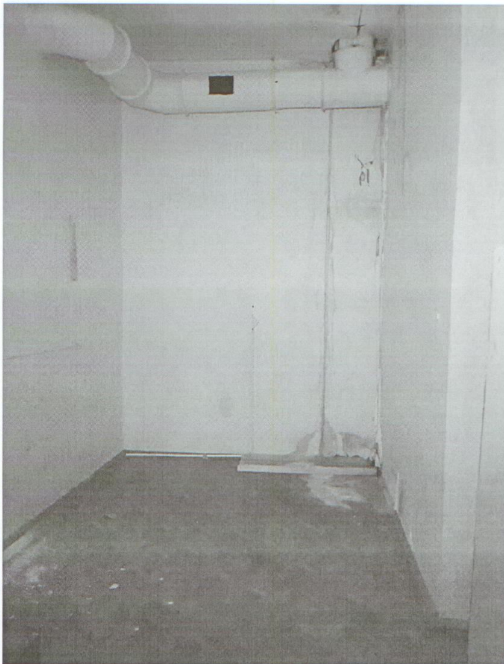
Помещение № 17