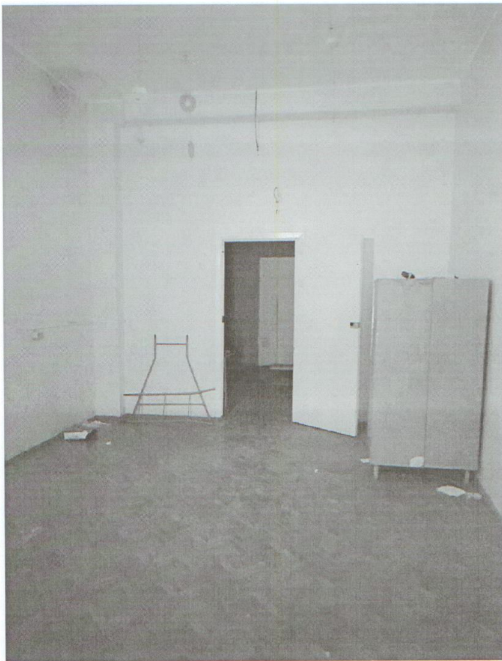
Помещение № 11