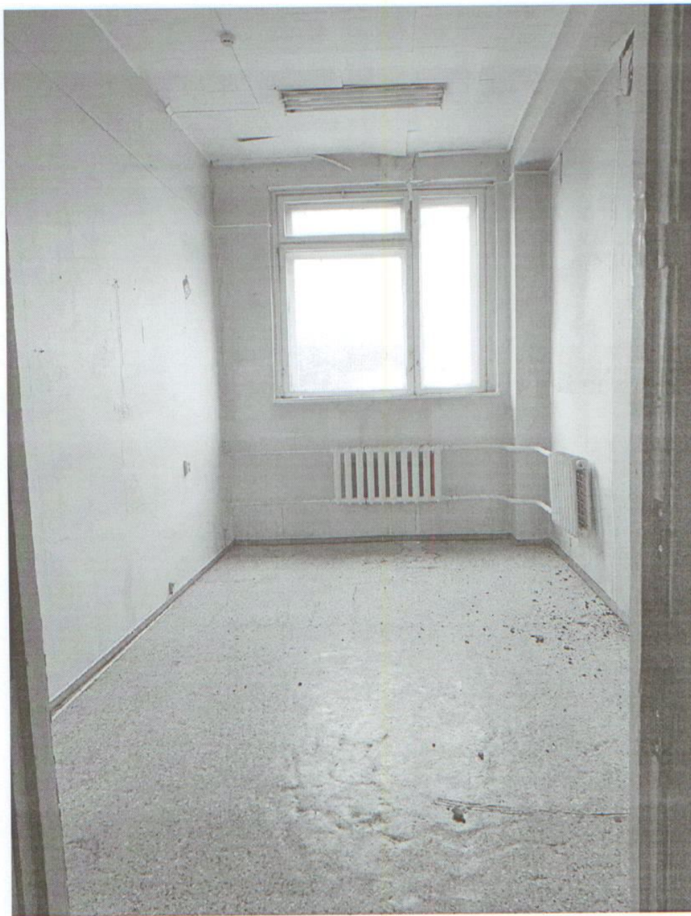
Помещение № 34