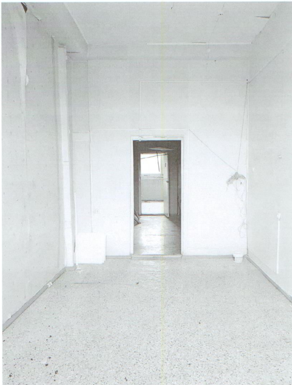
Помещение № 34