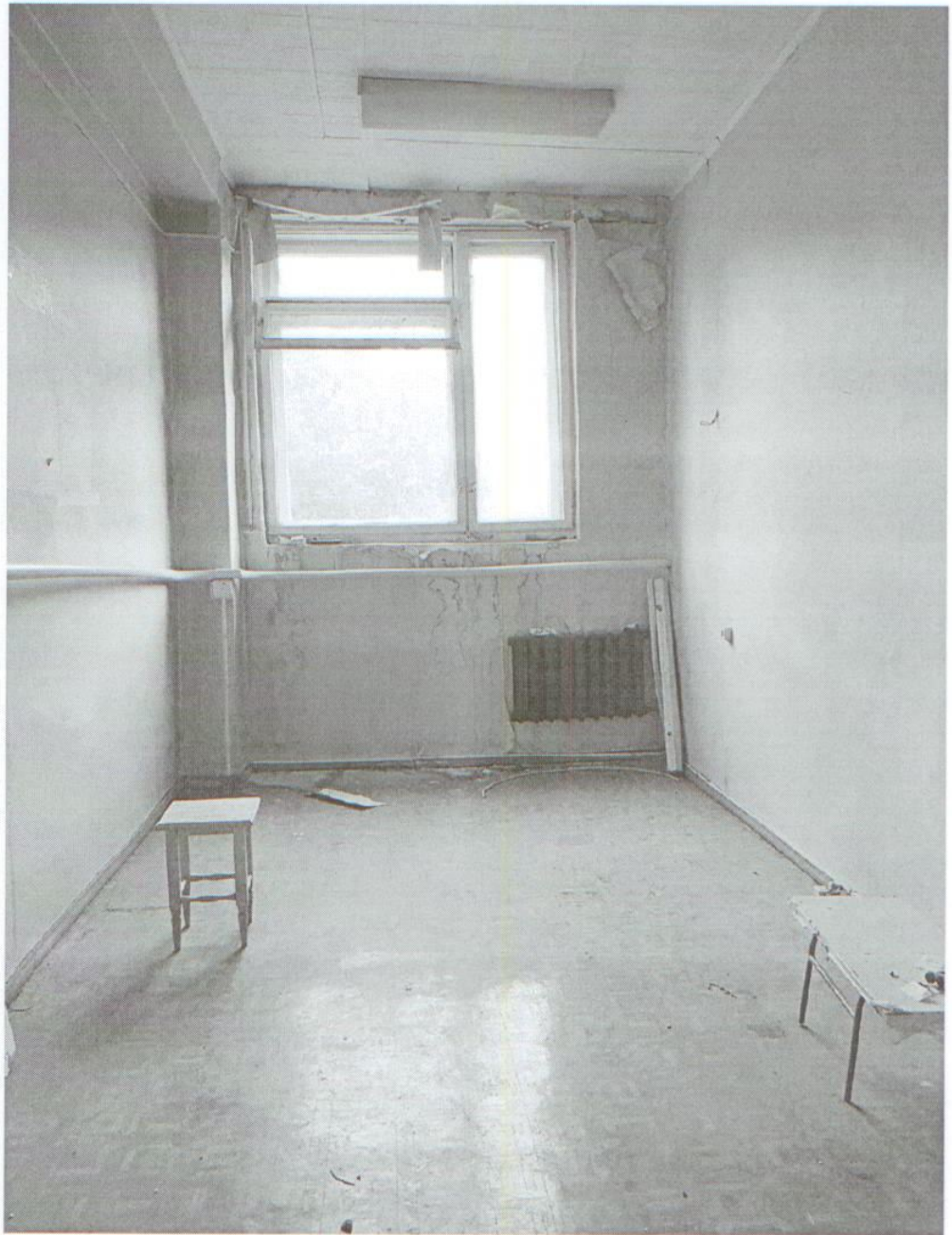
Помещение № 2