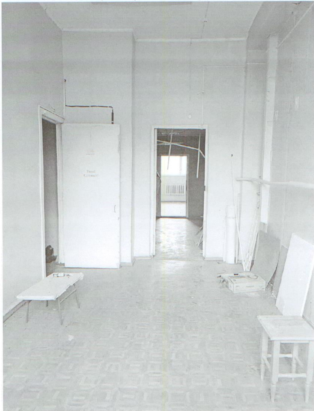
Помещение № 2